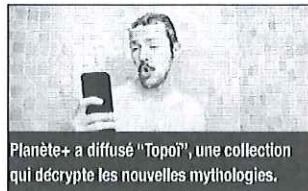
Planète+ a diffusé "Topoi", une collection qui décrypte les nouvelles mythologies.

Selon les chiffres du bilan de la production audiovisuelle aidée du CNC, l'investissement des chaînes thématiques payantes (sauf Canal + et en comptant les chaînes thématiques du groupe Canal) dans la production audiovisuelle aidée atteint près de 400 millions d'euros depuis 2007 dont 45,1 millions d'euros en 2016. Elles ont contribué à hauteur de 20,6 millions d'euros au documentaire en 2016, indique un communiqué. Elles ont investi plus de 200 millions d'euros dans la production documentaire depuis 2007 et com-