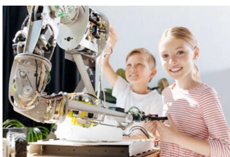
Nous demain : quelle vie professionnelle pour nos enfants ?

Les chaînes thématiques payantes se préoccupent aussi du monde d'aujourd'hui, de celui de demain, de notre planète, du futur de notre société . Après Rêver le futur, la série qui va vous faire aimer 2050 , coproduite avec Update Productions et FOOD 3.0 (PLANETE+/ Nova Media/ La compagnie des taxis Brousse), PLANETE+ accompagne l'odyssée du premier catamaran 100% énergies renouvelables, Energy Observer (PLANETE+/ Memento) et proposera Nous demain : quelle vie professionnelle pour nos enfants ? (J2F Prod – LSD Films) et Solar Stratos (Gedeon) tandis que L'Air du temps (VOYAGE/ Windy production) et Le maître des éléments (AB Productions/ Docland Yard/ Science et vie TV) nous entraînent à la découverte des énergies du futur dans toute leur diversité.